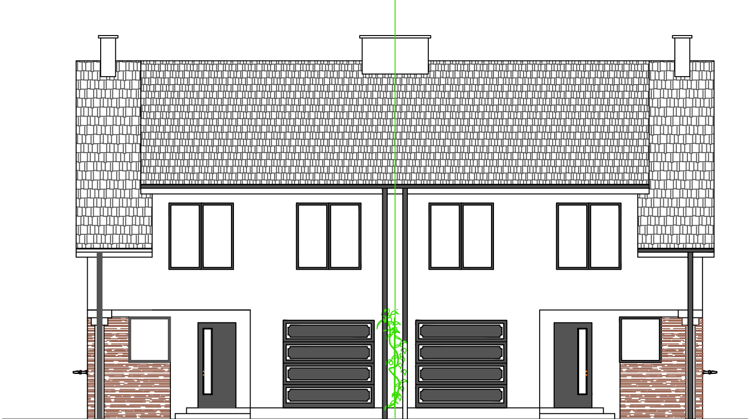
DOM MIESZKALNY JEDNORODZINNY PRAWY